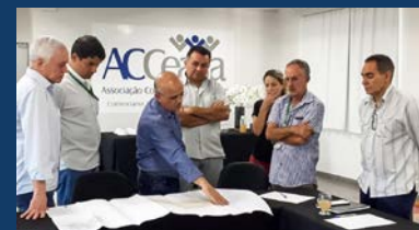
Reunião da Comissão de Trânsito e Estacionamento