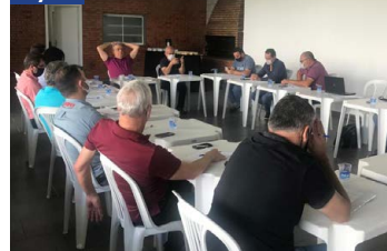
Reunião Ordinária do Conselho de Administração