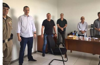
Comitê de crise para avaliação de estratégias para o entreposto de Contagem