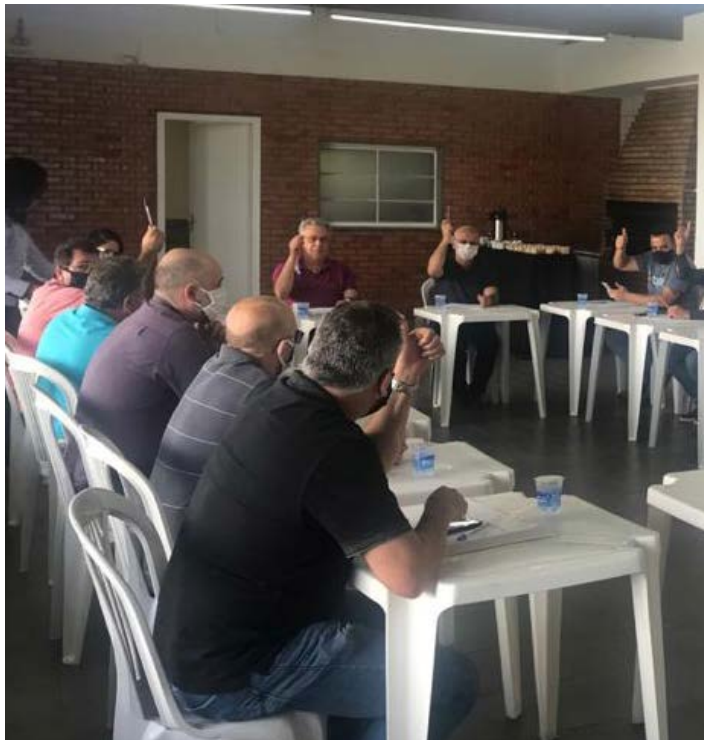
Assembleia Geral Ordinária, realizada na sede da ACeasa, em 23 de abril, aprova prestação de contas da entidade referente ao exercício de 2019.