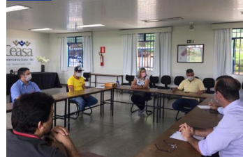
Diretoria da ACeasa avalia medidas de prevenção ao Coronavírus no entreposto.