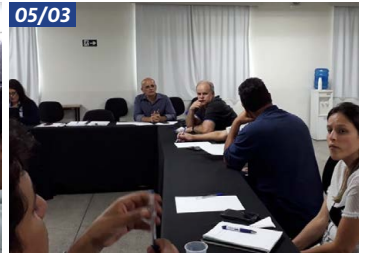
Comissão de pátio de veículos leves na ACeasa