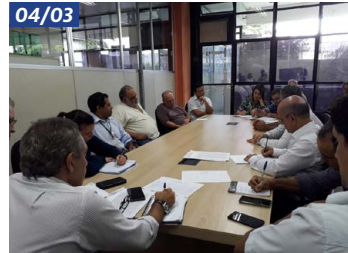
Reunião da comissão de embalagens