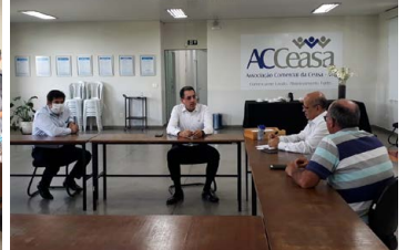
Diretoria da ACeasa e representantes do Bradesco.