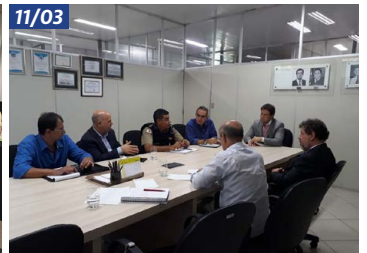
Reunião com a CeasaMinas, Receita Estadual e Polícia Rodoviária Federal e Polícia Militar