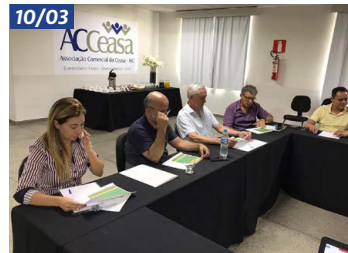
Reunião mensal da Diretoria Executiva da ACeasa