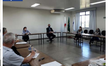
Reunião mensal da Comissão de RDC na ACeasa