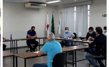
Representantes da CeasaMinas e ACeasa discutem assuntos relacionados à RDC.